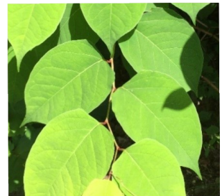
Feuilles triangulaires à bout effilé