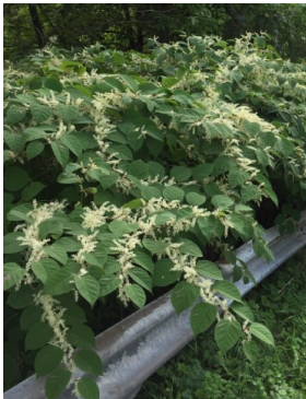
Grappes de petites fleurs

Sa beauté est toutefois un piège puisqu'une fois plantée, la renouée du Japon se répand rapidement en formant de denses colonies.